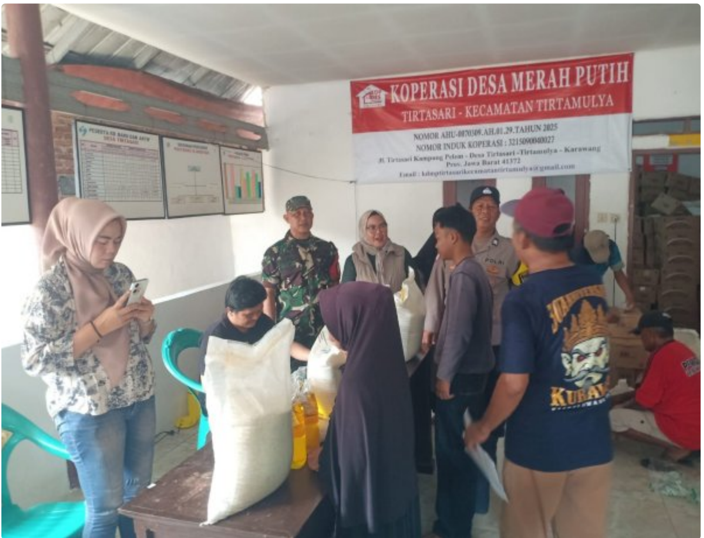
Bhabinkantibmas dan Babinsa Beri Rasa Nyaman Pembagian Bantuan Pangan di Desa Tirtasari Wilkum Polsek Cikampek